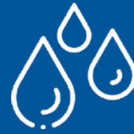
Diritto all'acqua e ai servizi igienici