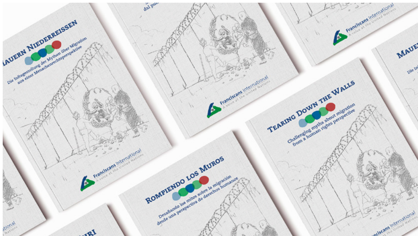
“Abbatere i Muri” è disponibile in inglese, tedesco, italiano, portoghese e spagnolo