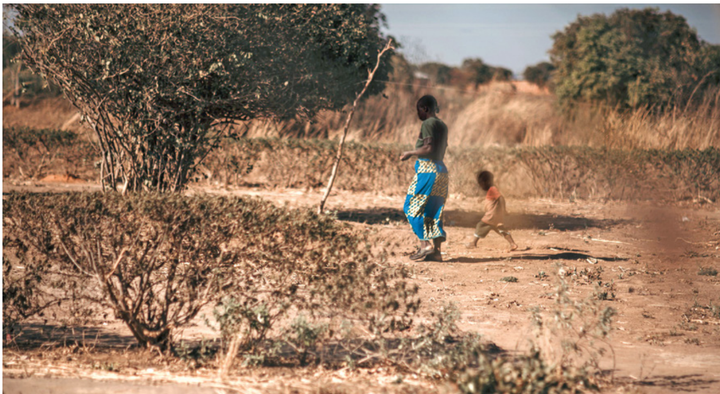
Una donna e un bambino della città di Kabwe, Zambia, colpita dall'inquinamento da piombo a causa delle vicine miniere