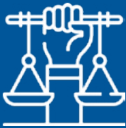
Giustizia e responsabilità