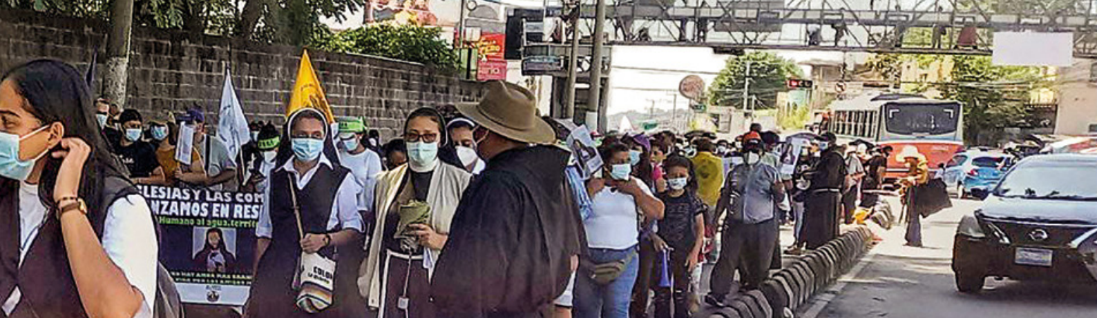
Francescani in una dimostrazione per il diritto costituzionale all'acqua