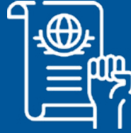
Tutela dei difensori dei diritti umani