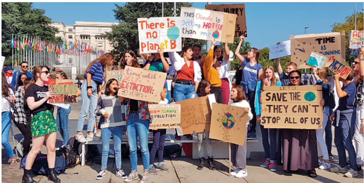
Franciscani durante una protesta per il clima a Ginevra

Franciscans International desidera esprimere la sua sincera gratitudine agli Ordini e alle Congregazioni Francescane e a tutti i singoli donatori per il loro sostegno a questo Ministero Comune.