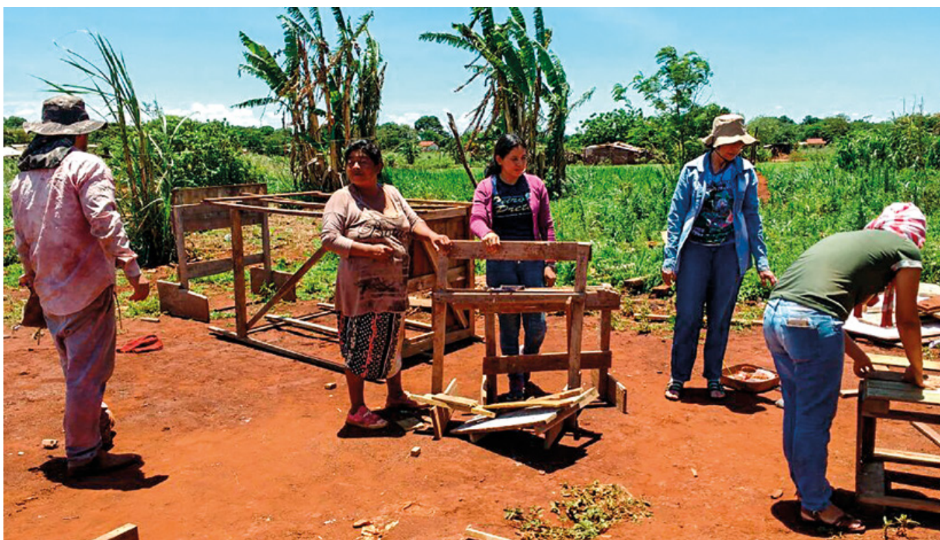
Las hermanas catequistas franciscanas trabajando junto con los guaraní-kaiowás