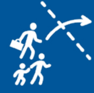
Persone in movimento